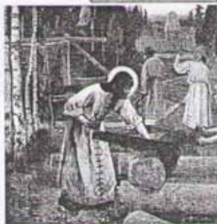
М. Нестеров. Труды Сергия Радонежского. Фрагмент

Итак, с христианской точки зрения труд — это не просто средство пропитания (хотя очень точны слова апостола Павла: «Если кто не хочет трудиться, тот и не ешь»). Труд — это ещё и то лекарство, которое прописано человечеству Богом. Труд даёт человеку опыт, знания, закаляет его характер.