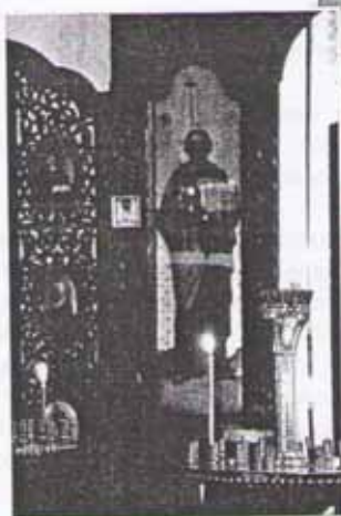
Храм — место покаянной молитвы