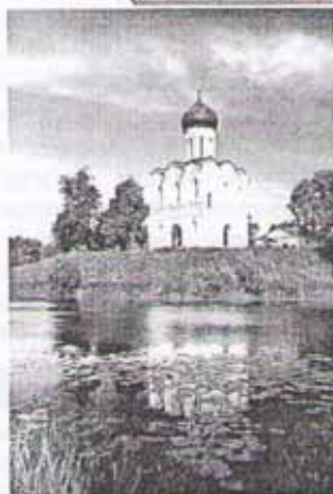
Храм Покрова на Нерли. Близ с. Владимира

Люди приглаждались к новой для них вере. На их сердца влияли не только поучения священников. Они видели, как изменился сам их правитель. Князь Владимир открывал школы для детей, рассылал повозки с едой, чтобы никто не голодал. В Киеве он начал строить храмы — они стали первыми