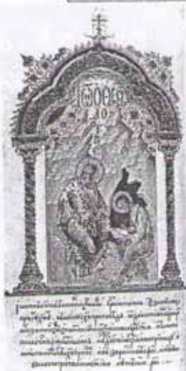
Апостол Иоанн диктует Евангелие своему ученику. Миниатюра

Христиане считают Христа не просто пророком, но тем Богом, который вдохновлял пророков. Молитву «Отче наш» дал людям именно Господь Иисус Христос, поэтому у неё есть второе название — «Молитва Господня». Апостолы, услышав эту молитву от Иисуса, записали её в Евангелии.