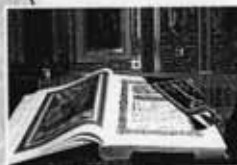
Евангелие в храме

П равославные люди — это христиане. Христианин — это человек, который принял учение Иисуса Христа.