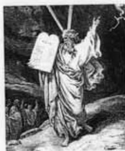
Г. Доре. Моисей с заповедями на горе Синай