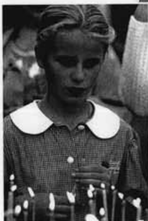
В храме со свечой