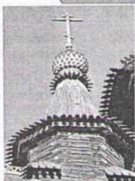
Тяга к небу...

— Я Христофор... Пришла мне с юности охота послужить самому сильному господину. Нашёл я царя, самого сильного, и подвизался на него работать как на своего господина. А как услышал, что царь тот боится чёрта, ушёл я чёрту служить. Да увидел я однажды, как чёрт от креста бежит: Распятого боится. Ну, и пошел я тогда искать Распятого. Забрёл в пустыню, а там старец отшельник стал мне сказывать про Христа. Я и говорю ему: «По всему вижу, что Он сильнейший. Ему и послужу». И слышу раз ночью — слабый голос зовёт. Вижу у воды