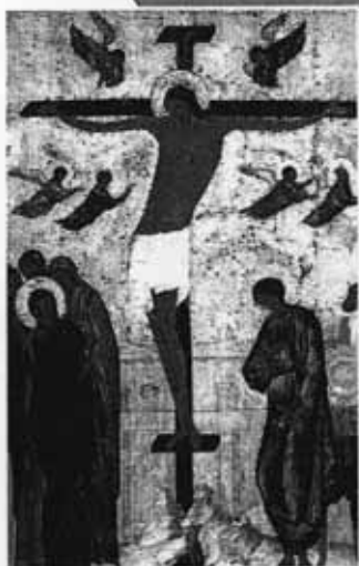
Дионисий. Распятие. Икона

Когда Его арестовали, Он ни ангелам, ни апостолам не позволил защитить Его. Он не спорил со Своими судьями. Если бы Он их