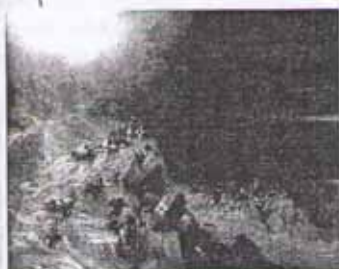
И. Айвазовский. Всемирный потоп

Х ристиане верят в то, что у мира есть Творец. Бог вложил Свою любовь и мудрость в мир. Поэтому, познавая мир, христианин постепенно постигает и замысел его Творца.