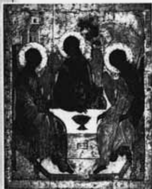
А. Рублёв. Троица. Икона

Х ристиане стремятся творить добро не только из желания получить духовную радость. Они верят в то, что для чуда есть место не только в сказке, но и в жизни.