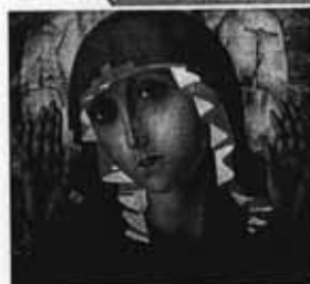
К. Петров-Водкин. Богородица Умиление любых сердец

Милосердие напоминает, что есть мелкие неприятности, а есть настоящие несчастья. Кто-то однажды подставил тебе подножку — ты упал, набил себе шишку, а он посмеялся. Это неприятно. Но прошло время, и этот кто-то сам смешно растянулся на брошенной банановой шкурке. Да так сильно, что повредил ногу и самостоятельно не смог подняться. Это беда. Ты сможешь забыть ту подножку? Сможешь не обрадоваться его беде? Сможешь подойти, помочь ему, позвать врача?