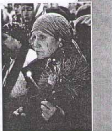
На праздничной службе