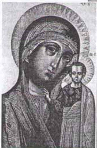
Богоматерь Казанская. Икона