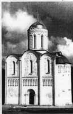
Дмитриевский собор. Владимир