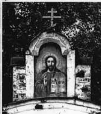
Надвратная икона. Храм Благовещения Господня, Владимирская область, с. Заречное

Однажды люди привели ко Христу женщину, которую по законам того времени надо было казнить — забросать камнями до смерти. Христос не стал призывать людей к нарушению этого закона. Он просто сказал: «Пусть первый камень бросит тот из вас, кто