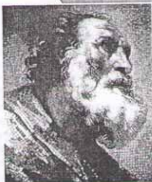
Апостол Пётр. Мозаика

У совести есть очень важная особенность: если забыть о нанесённых ею ранах, они никогда не зарастут. Даже спустя многие годы совесть может напомнить о былой неправде. Например, радость, получаемая от интересной поездки, может исчезнуть, потому что совесть вдруг подняла из глубин памяти что-то, о чём не хотелось бы помнить. Поэтому самое главное в жизни человека — быть в ладу со своей совестью. Надо уметь её слышать и поступать по её подсказкам, исправляя свои прошлые ошибки.