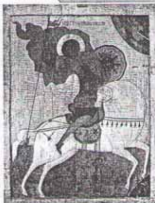
Георгий Победоносец. Икона