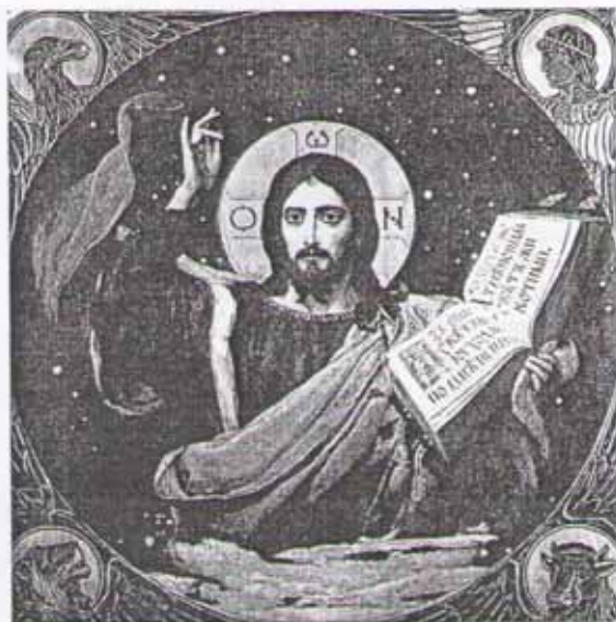
В. Васнецов. Христос Вседержитель

Книги Ветхого Завета написали пророки. Считалось, что это люди, которые имели особый дар — слышать, что говорит им Бог. Такой дар называется пророчеством, а человек, имеющий этот дар от Бога, — пророком.