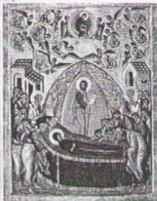
Успение Богородицы. Икона

В культуре христианских народов есть много рассказов о том, как человек совер-