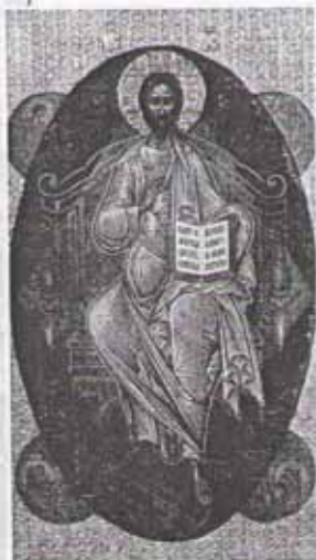
Спас в силах. Икона

Можно всех сокрушить, двигаясь к вершине власти. Весь мир будет бояться такого