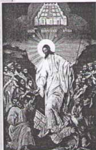
Воскресение Христово. Икона

История Христа не заканчивается Его казнью. Ведь Он сказал Понтию Пилату, что имеет власть снова принять Свою жизнь. Поэтому Евангелие говорит, что после распятия Христос вернулся к жизни — воскрес.