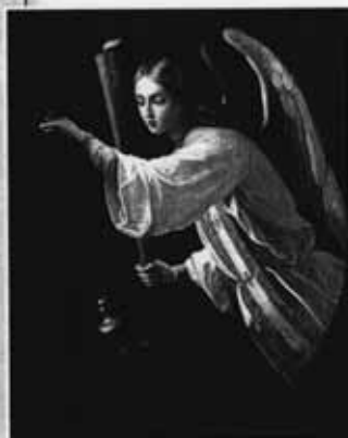
Ангел молитвы. Роспись храма

Более редкая молитва — это молитва-благодарение . Редкая потому, что люди чаще просят, чем благодарят. Получив желаемое, мы часто, к сожалению, забываем побла-