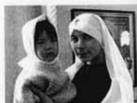
Сестра милосердия с ребёнком в детском саду