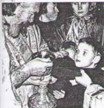
В православном понимании священник похож на почтальона, который посылки от Бога (таинства) разносит людям

Для этого Он создал Свою Церковь, в которой Он же совершает таинства. Важнейшие из них — Причастие и Крещение.