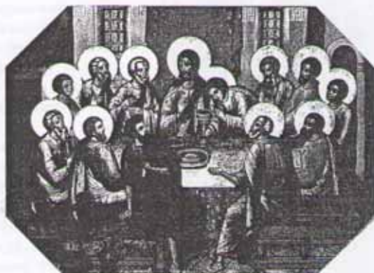
С. Ушаков. Тайная вечеря. Икона