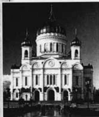
Храм Христа Спасителя. Москва

Здесь служит Патриарх Московский и всея Руси