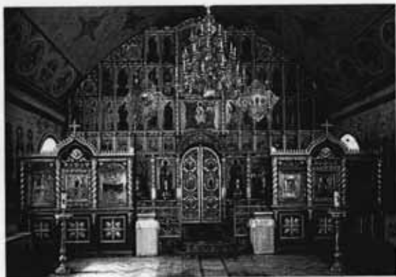
Иконостас с зарзскими вратами в храме