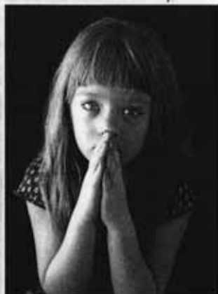
Молиться можно и вслух, и про себя