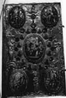
Евангелие в драгоценном окладе