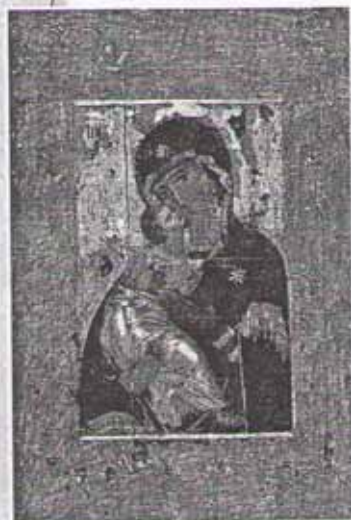
Богородица Владимирская. Икона

каменными постройками на Руси. Кстати, во все последующие века село отличалось от деревни именно тем, что в нём стоял храм.