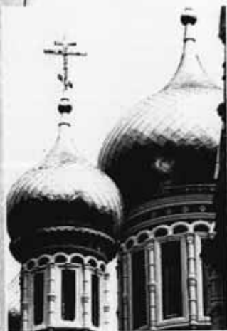
Купола православного храма

Есть области культуры, общие для всех людей или для всей страны. Но есть и различия в народных культурах.