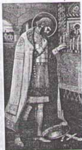
М. Нестеров. Святой князь Александр Невский. Эскиз мозаики