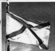
Андреевский флаг — знамя Военно-морского флота России