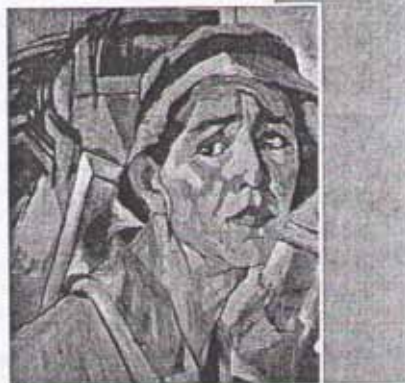
А. Дейнека. Автопортрет

Царь был человеком с жестокой и холодной душой