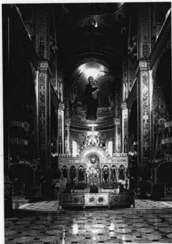
В. Васнецов. Интерьер Владимирского собора в Киеве

И ещё. Всё, что связано с именем Бога, даже на письме оформляется особым образом. Загляните в рубрику «Это интересно».