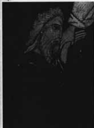
Прощение. Фрагмент иконы

На некоего человека напали разбойники, избили его и ограбили. Прохожие остались прохожими. Они проходили мимо. Каждый