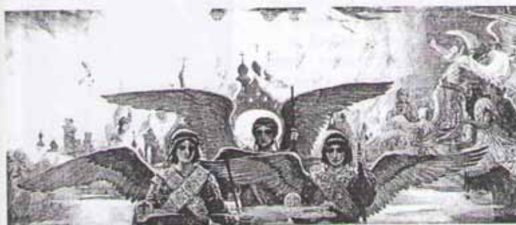
В. Васнецов. Радость праведных о Господе. Преддверие Рая. Роспись купола Владимирского собора в Киеве. Эскиз