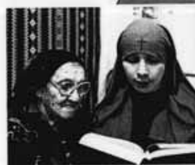
В Доме милосердия