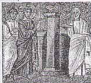
Христос предсказывает Петру предательство. Мозаика