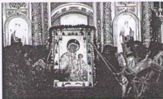
Иверская икона Божией Матери переносится из Греции в Москву

Для верующего человека жизни Христа и святых так дороги, что при виде их образов он хотя бы кратко молится им. Икона приглашает людей к молитве, а главное — к подражанию жизни святых. То есть такой жизни, в которой главное не самоугождение, а любовь к людям.