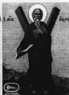
Апостол Андрей. Икона

В се люди согласны с золотым правилом этики: «Как хотите, чтобы с вами поступали люди, так поступайте и вы с ними». Но у христиан есть особые причины для того, чтобы не быть эгоистами.