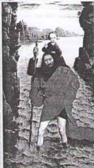
Б. Диркс. Святой Христофор

Пришли греки к князю Владимиру философа. Он показал Владимиру завесу, на которой изображён был суд Господень. Владимир, вздохнув, сказал: «Хорошо тем, кто справа, горе же тем, кто слева». Философ ответил: «Если хочешь с праведниками справа стать, то крестись». Владимиру запало это в сердце, и сказал он: «Подожду ещё немного», желая разузнать о всех верах. И дал Владимиру философу многие дары и отпустил его с честью великою.