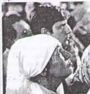
Люди слушают проповедь

Христос говорил людям не только о том, как они должны относиться друг к другу. Ещё Он говорил об отношениях Бога и людей. Каждого человека Он призывал: «Возлюби Господа Бога твоего всем сердцем твоим, и всей душой твоей, и всем разумом твоим».