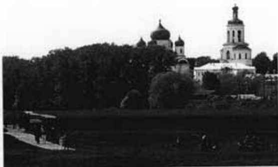
Дорога к храму

совести, ни любви, то может получиться просто хитрый преступник. Поэтому людям также даны совесть, доброта, любовь.