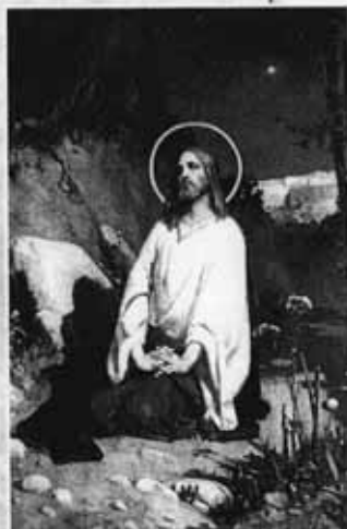
В. Котарбинский. Христос в ожидании ареста

В яслях лежит Ребёнок. Матери нежен лик. Слышат волны спросонок Слабенький детский крик. Придёт Он не в блеске грома, Не в славе побед земных, Он трости не переломит И голосом будет тих. Не царей назовёт друзьями, Не князей призовет в совет — С галилейскими рыбаками Образует Новый Завет. Никого не отдаст на муки, В узилища не запрёт, Но Сам, распростёрши руки, В смертельной муке умрёт.