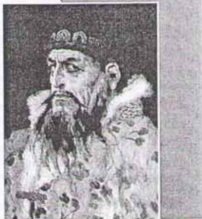
В. Васнецов. Иван Грозный

Непросто осознать, что душа существует. Ещё сложнее понять причины и цели её