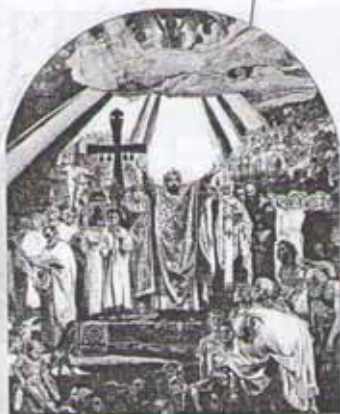
В. Васнецов. Крещение Руси