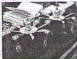
Венцы для венчания