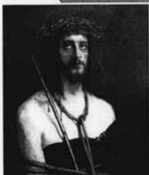
И. Крамской. Христос в терновом венце

Поэтому нижняя перекладина на православном кресте Христа поднята в правую сторону и опущена в левую. Это знак того, что благоразумный разбойник покаялся и пошёл ввысь, в Царство Небесное, а тот, кто даже в минуту смерти не попробовал измениться, так и завершил свою жизнь в низости.