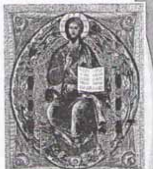
Спас в силах. Икона