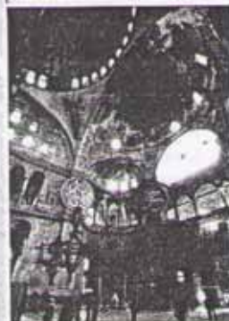
Храм Святой Софии. Внутренний вид. Стамбул

О днажды молодой христианин зашёл в храм к старому священнику, который славился святостью своей жизни. И вдруг услышал, что тот с ошибкой произнёс молитву. Юноша говорит: