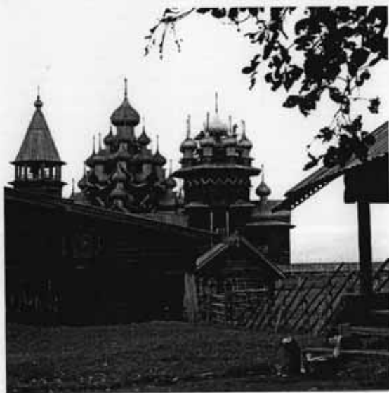
Деревянные храмы. Кижы. Карелия