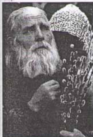
В православном храме