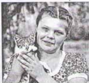
Хорошо, когда на душе светло