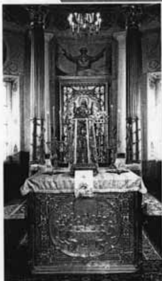
Алтарь в храме

— Нет, никаких секретов там нет. Просто человек должен понимать, что не всё ему позволено. Запрет на вход в алтарь и многие другие ограничения, которые есть в православии, напоминают человеку, что не всё надо стремиться переделывать по своей воле. Вы видели деревья, которые подрезают, чтобы они росли не вширь, а вверх? Вот также в любой культуре есть система запретов, направляющих рост человека, его развитие. Чтобы этому научиться, надо уметь слушать. Надо уметь останавливаться и уступать. Надо уметь ждать и понимать. Надо уметь служить Богу, людям, Родине.