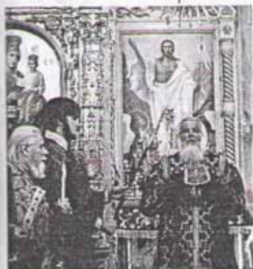
Литургия в храме

мали теперь слова Христа: «Пребудьте в любви Моей... Радость Моя в вас да будет ...»