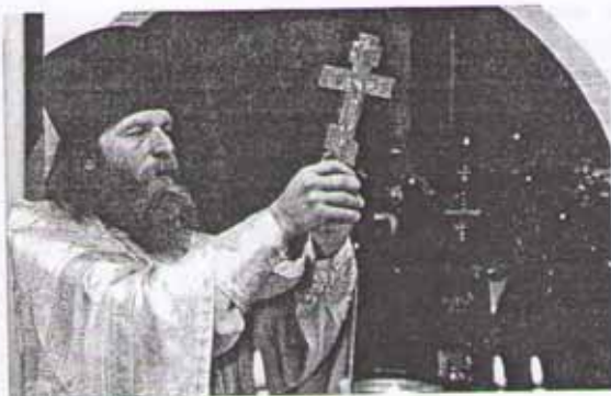
Священник в храме благославляет верующих во время службы

Однажды, когда Христос учил людей, принесли к Нему расслабленного (парализованного) человека. Но дом, где учил Христос, был переполнен слушателями. И даже снаружи, у окон и двери, стояло столько народа, что провести носилки с больным было невозможно. Тогда родственники расслабленного залезли на крышу дома, разобрали кровлю, а в отверстие спустили носилки прямо к ногам Христа. И Он, видя такую их веру, сказал расслабленному: «Дитя, прощаются тебе грехи твои. Встань, возьми постель твою и иди в дом твой». И тогда ранее неподвижный человек встал, взял носилки, на которых лежал, и пошёл в дом свой, славя Бога.