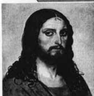
А. Иванов. Христос

Но свободный несмышлёныш может быть опасен. Вот почему к свободе полагается ещё и разум. Но если рядом с разумом нет ни