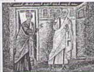
Отречение Петра. Мозаика

В православии добро — это то, способствует росту души человека, помогает другим людям, радуется Богу.