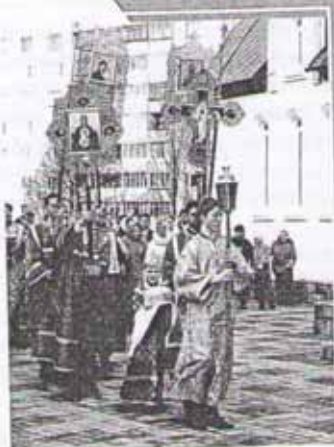
Крестный ход на Пасху

В честь воскресения Христа русский народ назвал свой еженедельный праздничный день. Особо торжественно отмечается то весеннее воскресенье, которое так и называется — Пасха Христова (буквально слово «пасха» в переводе с древнееврейского языка означает «переход», «избавление»).