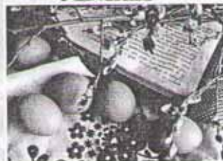
Пасхальное угощение: кулич и крашеные яйца