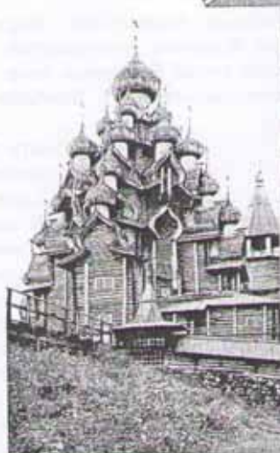
Преображенская церковь. Кижй. Карелия