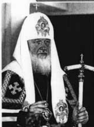
Патриарх Московский и всея Руси Кирилл

Вера — это верность самым светлым минутам своей жизни. Порой человеку может показаться, что всё потеряло смысл, что надо покинуть свой дом, любимого человека, саму жизнь... Но человек вспоминает то светлое, что когда-то было в этом доме, в его жизни, в его дружбе, в его любви. И ради этого светлого он остаётся другом и сыном, мужем и воином. Остаётся с верой в возвращение света, понимания и любви.