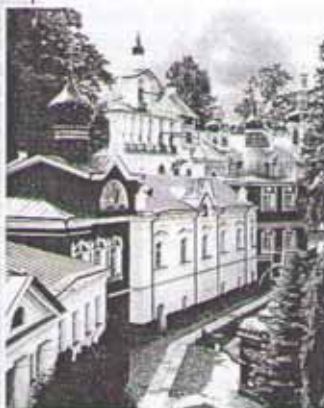
Монастырь — образ Царствия Божия на земле

И горожане, и князья стали зазывать монахов к себе: «Вы вернитесь из ваших пустынь. Мы построим для вас храмы и дома, вокруг них построим стены, чтобы шум и вид городской суеты не касался вас. Но