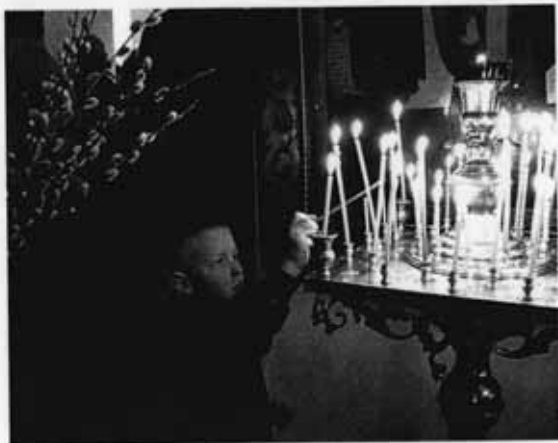
Мальчик в храме

Слово «Бог» в русский язык вошло из очень древнего языка, на котором несколько тысяч лет назад говорили предки и нашего, и многих других европейских и восточных народов (включая индусов). На этом древнем языке «бага» или «бхага» означало «доля», «порция», «удел», «часть», в том числе «богатство». Затем же это слово стало обозначать того, кто распределит эти дары, то есть самого Бога.