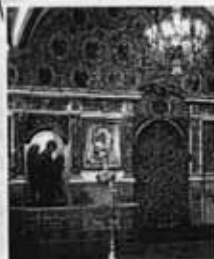
Иконостас в храме

Х рам заполнен иконами. Одни из них помещены на стенах, а другие стоят на полу. Это люди. Слово «икона» в переводе с греческого языка означает «образ».