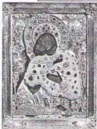
Богоматерь Умиление. Икона

Необычно также, что линии на иконе не сходятся вдали, а, напротив, расходятся. Когда вы смотрите на мир, то, чем дальше от вас предмет, тем он кажется меньше. Где-то вдали даже самый большой предмет превращается в крохотную точку (например, звезда). А что же тогда означает, если линии на иконе вдали расходятся? Это значит,