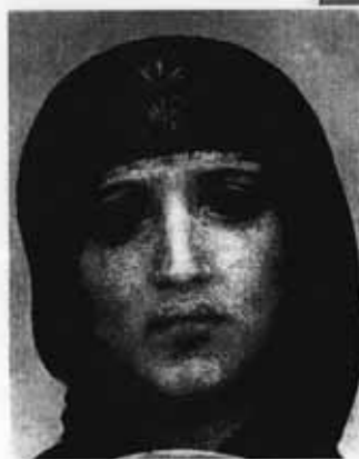
М. Врубель. Богоматерь с младенцем. Фрагмент росписи в храме