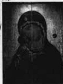
Богоматерь Владимирская. Икона