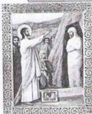
Воскрешение Христом Лазаря. Икона

Некоторые люди сочли это оскорблением своей веры в Бога. По их мнению, Бог не мог сотворить такого чуда и стать столь близким к людям. Они объявили Христа преступником и стали добиваться Его казни. Христос же не стал уклоняться от суда и добровольно пошёл на казнь.