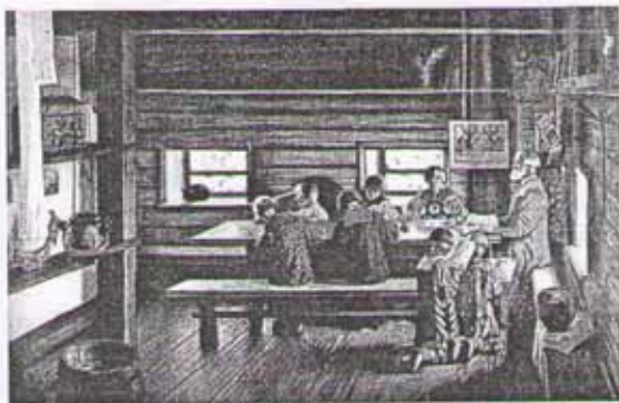
Б. Кустодиев. Земская школа в Московской Руси

ми, поднявшиеся над соломенной повседневностью, — они издали издали кивают друг другу, они из сёл разобщённых, друг другу невидимых, поднимаются к единому небу.