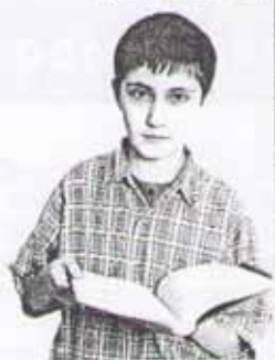
Душа обязана трудиться

При самых разных поворотах судьбы стоит прежде всего ставить вопрос: «А что будет с моей душой? Придётся ли ей по вкусу радость, добытая постыдным путём?»