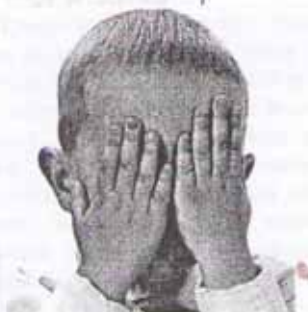
Раскаяние обновляет душу

Некоторые стараются просто забыть нанесённые кому-то обиды. Вспомните песенку Крокодила Гены из известного мультфильма: