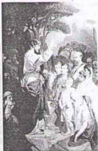
И. Макаров. Назорная проповедь

исчезнуть. Даже если тело, которым душа управляла, окончило свою жизнь, душа остаётся. Но то, что она нажила (доброе и плохое), она приносит на Небо — пред лицо Бога.