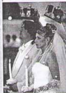
Венчание в храме

С емья — это маленький ковчег (прибежище), призванный ограждать детей от беды.