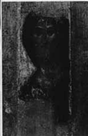
А. Рублёв. Спас. Икона

У кого-то совесть чуткая, а у кого-то не очень. Чтобы у людей было ясное основание, по которому можно различать добро и зло, существуют заповеди. Заповеди записаны в Библии, которая говорит о том, что они даны людям от Бога.