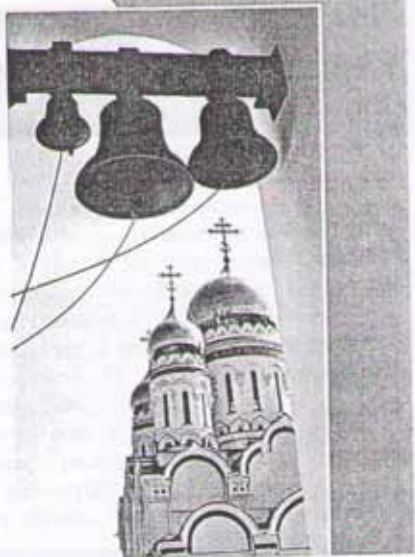
Колокольный звон на Пасху слышен во всех храмах

Всю неделю после пасхальной ночи праздничная служба повторяется по утрам, причём и дети могут участвовать в шествии крестного хода. Более того, именно в эти пасхальные дни у ребят есть возможность ударить в настоящий огромный колокол. Во многих храмах в первые семь дней Пасхи открыт доступ на колокольню, и любой человек (в том числе ребёнок) может подняться и позвонить в колокола.