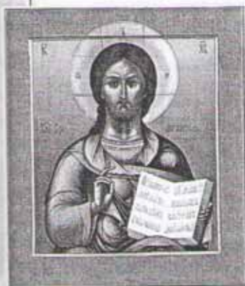
Спас в силах. Икона

Царство Небесное — это синоним рая. Многие легенды говорили о рае как о какой-то очень далёкой и недостижимой стране или как о месте, в которое души летят после смерти тела.