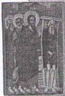
Исцеление Христом расслабленного. Фрагмент иконы

Духовные сокровища Евангелие связывает с Небом потому, что Бог не позволяет душе