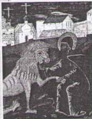
Преподобный Герасим Иорданский приручает льва. Фрагмент иконы Даже животные чувствуют добрую душу