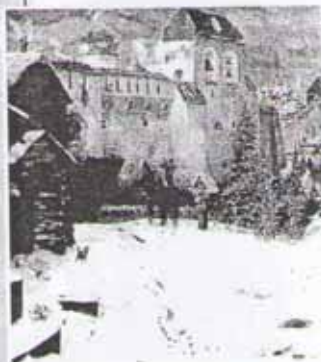
А. Васнецов. Старорусский город

Когда в 1812 г. французский император Наполеон привёл свою армию в Россию, то