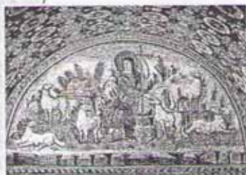
Добрый пастырь. Мозаика