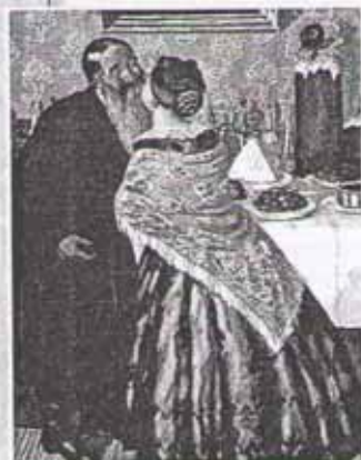
В. Кустодиев. Христосование

Для встречи Пасхи православные собираются в храмах. Самая торжественная часть праздничного богослужения — пасхальная полночь. Священник несёт крест, а люди с иконами и зажжёнными свечами обходят вокруг храма (это называется «крестный ход») и поют радостные пасхальные гимны.