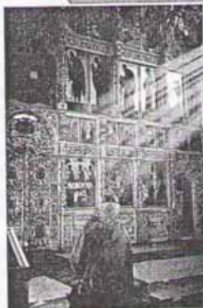
Царские врата напоминают о Царстве Христа

В библейские времена люди считали, что олени воюют со змеями. Они полагали, что укус змеи для лани опасен, но если лань быстро напьётся воды, то вымоет из себя яд. В библейском псалме (гимне) говорится: «Как (укушенная) лань желает к потокам воды, так желает душа моя к Тебе, Боже». Для пророка стремительный бег оленя к