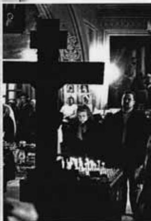
Прихожане ставят свечи на канун

Благословение — это такое пожелание добра, которое сочетается с молитвой к Богу о том, чтобы это добро осуществилось. При этом обычно говорят: «Именем Христа...», «Во имя Христа...», «Бог да благословит...».