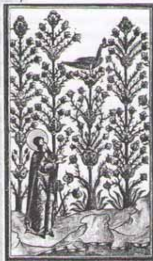
Райские кусты. Старинный рисунок

Сначала Библия говорит о том, как трудился Бог, создавая наш мир, а потом — о том, как Бог призвал к труду человека. Первые люди (Адам и Ева) были поселены в райском саду. Это был уголок земли, где звери слушались людей и где не было смерти.