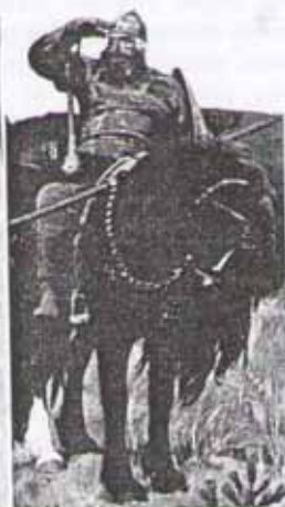
В. Васнецов. Богатыри. Фрагмент

князь Дмитрий Донской собрал полки из русских городов для отпора врагу. Пока дружины собирались, князь поехал в подмосковный Троицкий монастырь, основанный святым Сергием Радонежским. Сергей стал уговаривать князя избежать кровопролития. Может, можно послать послов? заплатить дань? Князь сказал, что все возможности исчерпаны. Путь к миру больше нет. И тогда святой Сергей тихо сказал ему: «Ступай с Богом! Ты победишь». И благословил Пересвета и Ослябю (бывших воинов, ставших монахами в его монастыре) вернуться в боевые ряды. Пересвет и Ослябя в трудную для Родины минуту из монастыря снова вышли на поле боя — это было поле Куликово. Именно как монахи они хорошо знали слова Христа: «Нет больше той любви, как если кто положит душу свою за ближних своих» (здесь слово «душа» — в значении «жизнь»).