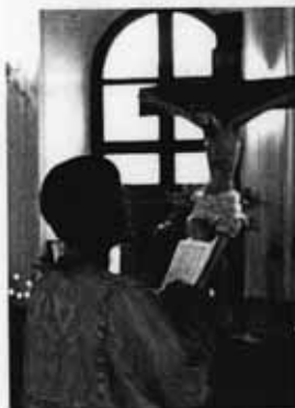
Молитва в храме