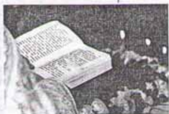
Священные тексты звучат во время службы в храме