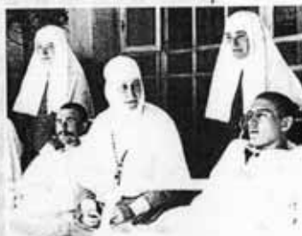
Великая княгиня Елизавета Фёдоровна ухаживает за ранеными солдатами. Москва, 1915 г.