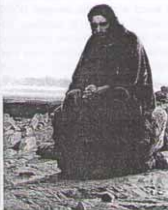
И. Крамкой. Христос в пустыне. Фрагмент картины

Подвиг — это движение в сторону от эгоизма, то есть от привычки считать себя центром не только своей жизни, но и жизни других людей. Эгоист считает, что другие