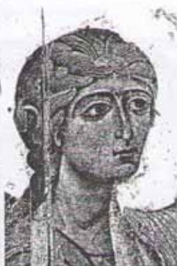
Благовещение. Фрагмент иконы

В православном храме проповедь и молитва ведётся на языках разных народов, в зависимости от того, где находится этот храм. Русская православная церковь молится на якутском, японском, английском, немецком, молдавском, чувашском, марийском и на многих других языках. Единственное исключение — русский язык. На русском языке ведётся проповедь, но богослужение идёт на церковнославянском языке. Это очень красивый язык, дорогой сердцу православных прихожан. Церковнославянский язык — общий язык для православных христиан России, Болгарии, Сербии, Чехии... Правила грамматики для этого языка, а также азбуку для него в IX в. создали просветители славян — святые Кирилл и Мефодий и их ученики.