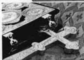
Крест и Библия

Истоки русской культуры — в православной религии. Например, слово «спасибо» — это сокращённое пожелание: «Спаси, Бог!» Каждый раз, когда человек произносит слово «спасибо», он, порой сам этого не понимая, обращается к Богу.